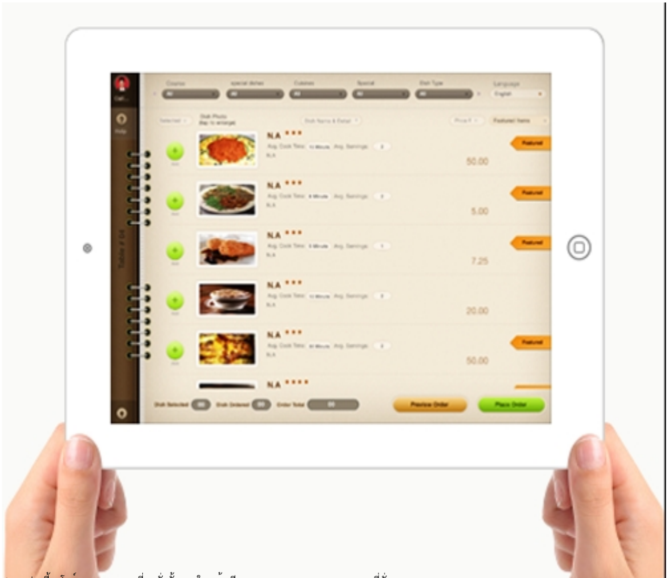
6. แอปฯ นี้จะโชว์รายการอาหารที่ถูกสั่งทั้งหมดในหน้าเดียวจากหลากหลายรายการอาหารที่สั่ง